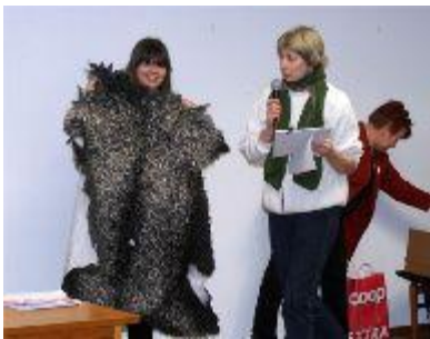
(1a), Fjällbete (ej med på bild)